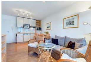
Wohnbereich, Essbereich, Küchenzeile