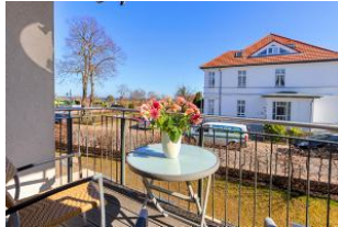
Balkon mit Ausblick