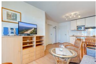
Wohnbereich, Essbereich, Küchenzeile

1. Reihe, direkt an der Strandpromenade mit BALKON und FAHRSTUHL im Haus! Schönes gemütliches 2-Zimmer-Apartment mit moderner guter Ausstattung. Separates Schlafzimmer, Wohnzimmer mit Küchenzeile und Essplatz, Duschbad, Balkon nach Osten - zum Frühstück in der Sonne mit ausschnittweisem Seeblick. Die Wohnung verfügt über einen Tiefgaragen-Pkw-Stellplatz. In der Garage können auch Fahrräder und ähnliches untergestellt werden. In unserer "Villa Germania" nebenan gibt es eine Sauna. Von der "Villa Aquamarina" sind es zum Ortszentrum und der Seebrücke ca. 3 Minuten zu Fuß. Zum Strand sind es 50 m.