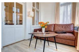
Wohnbereich in der Veranda