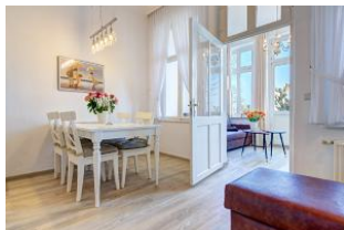
Essbereich und Lesecouch mit Blick zum Wohnbereich in der Veranda