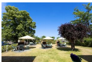
Garten mit Terrassen und Strandkörben (Mai bis September)