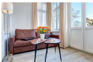
Wohnbereich in der Veranda mit direktem Gartenzugang und dortiger Terrasse