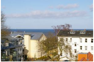
Seeblick vom Balkon