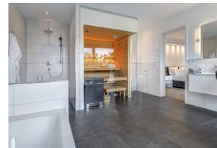
Bad 1 Sauna