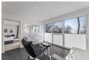
Bad 1 Seeblick