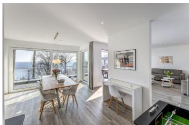
Küche Wohnen Seeblick