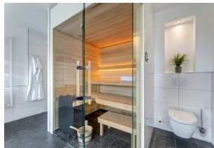
Bad 1 Sauna