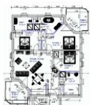
Wohnungsgrundriss (Möblierung exemplarisch)

STRANDNAH, GROSS, MODERN! Mit 2 BALKONEN (je ca. 11 qm), FAHRSTUHL, SAUNA und nur ca. 100 m zur STRANDPROMENADE! Großzügige elegante 4 - Zimmer - Wohnung mit sehr guter Ausstattung! 3 separate Schlafzimmer, 3 Bäder (2 davon ensuite), alle mit Fußbodenheizung. Die ensuite-Bäder verfügen über Wanne und Dusche bzw. Dusche. Das dritte Bad ist ein Saunabad mit Saunakabine und Schwalldusche. Der große Wohnbereich verfügt über eine vollausgestattete Küchenzeile, einen Eßbereich und einen Couchbereich mit KAMINOFEN. Die Balkone sind möbliert. Die Wohnung verfügt über einen Pkw-Stellplatz in der teilüberdachten Tiefgarage. Fahrradabstellfläche ist vorhanden. Vom Haus aus können Sie das Ortszentrum und die bekannte Ahlbecker Seebücke in ca. 2 Minuten zu Fuß erreichen.