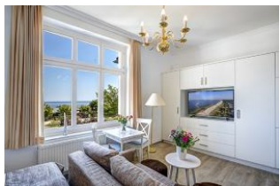
Wohnen, Essen, Seeblick

Direkt an der Strandpromenade mit direktem SEEBLICK! Schönes geräumiges 1 - Zimmer - Apartment im I. OG mit hübscher Möblierung und guter Ausstattung, Küchenzeile, Duschbad und Blick zur See. Die Wohnung verfügt über einen Pkw-Stellplatz. In der Garage können Fahrräder und ähnliches untergestellt werden. Im Haus gibt es eine Sauna. Von der "Villa Germania" aus können Sie das Ortszentrum und die bekannte Ahlbecker Seebrücke in ca. 3 Minuten zu Fuß erreichen. Zum Strand sind es 50 m.