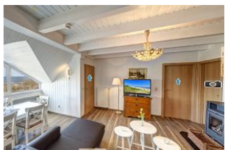
Wohnraum mit Seeblick

Direkt an der Strandpromenade mit phantastischem SEEBLICK und großem SÜDBALKON - das Besondere! Die außergewöhnliche 4-Zimmer-Wohnung mit zusätzlicher Empore nimmt das gesamte 2. Ober- und Dachgeschoss ein (ca. 96 qm). Drei separate Schlafzimmer (2 davon ohne volle Raumhöhe, gut geeignet für Kinder, Bad mit 2- Pers.-Whirlpool-Wanne und großer Dusche, zus. Gäste-WC, Küche, großes Wohnzimmer mit Kaminofen und verglaster Loggia mit Eßplatz und Seeblick sowie ein großer Balkon nach Süden mit Sonne bis abends machen die Wohnung zum Highlight! Das Mobiliar im Wohnzimmer ist teilweise antik, die Wohnung dennoch insgesamt modern und hell. Die Wohnung verfügt über einen Pkw-Stellplatz. Eine Garage für Fahrräder und ähnliches ist (für das gesamte Haus) vorhanden. Im Haus gibt es eine Sauna. Es sind vom Haus 50 m zum Strand, ca. 3 Min. zu Fuß ins Zentrum!