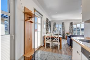
Küchenzeile mit Blick zum Essplatz