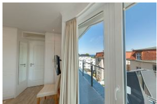
Blick aus Schlafzimmer