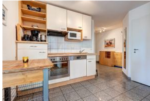
Küchenzeile und Blick in den Eingangshalle