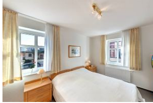
Schlafzimmer mit Fernseher