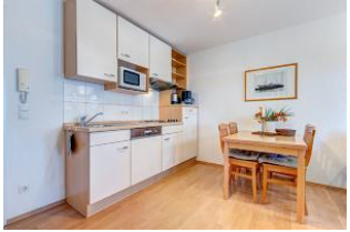
Essbereich und Küchenzeile