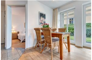
Essplatz und Blick in Schlafzimmer 1