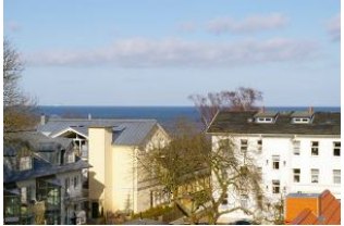
Seeblick vom Balkon