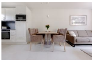
Wohnen Essen Küche