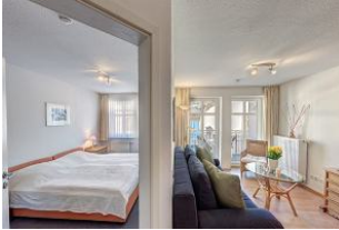
Tür zum Schlafzimmer