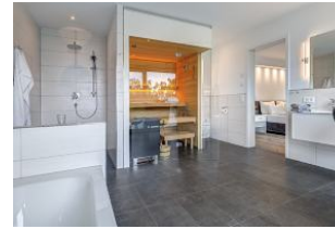
Bad 1 Sauna