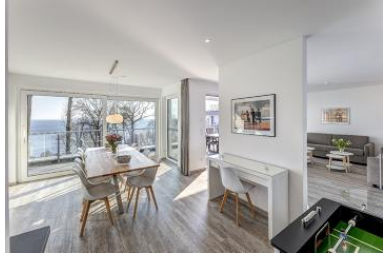
Küche Wohnen Seeblick