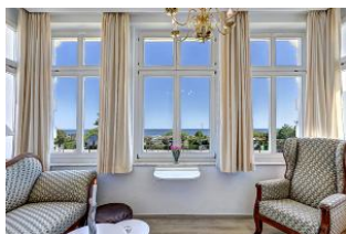
Veranda mit Seeblick