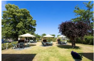
Garten mit Terrassen und Strandkörben (Mai bis September)