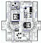
Wohnungsgrundriss (Möblierung exemplarisch)