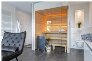
Bad 1 Sauna