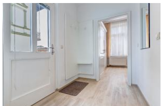
Eingangsfloor mit Blick zum Schlafzimmer